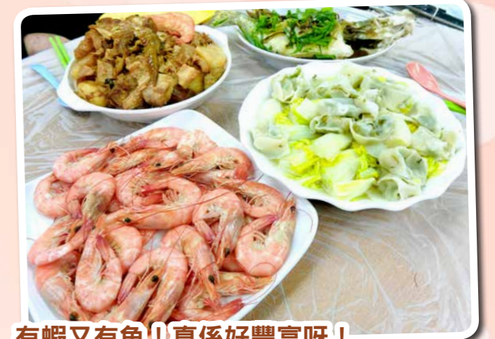
有蝦又有魚！真係好豐富呀！