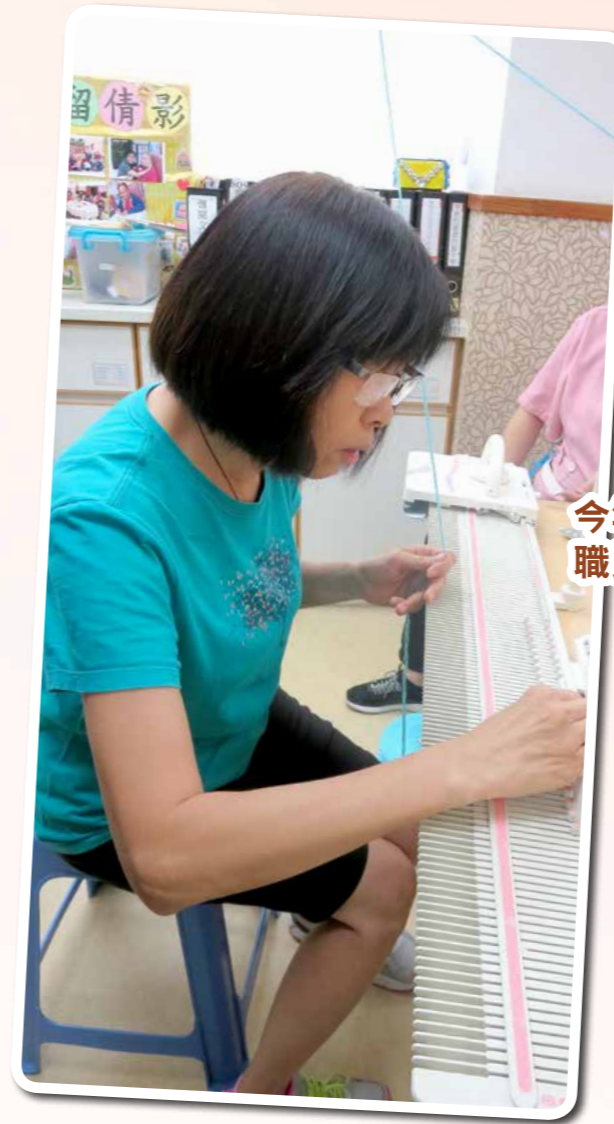
今年送出嘅靚靚頸巾背後，都係由一班家屬、職員同老友記用心編織架！