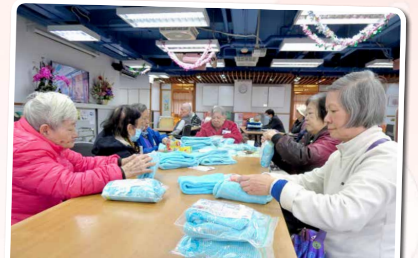
除咗有織男同織女外，仲有一班好合拍嘅老友記幫手摺好及包裝，等其他長者收到佢地嘅心意。