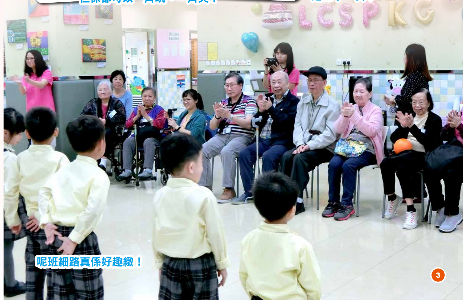
呢班細路真係好趣緻！