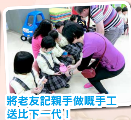
將老友記親手做嘅手工送比下一代！