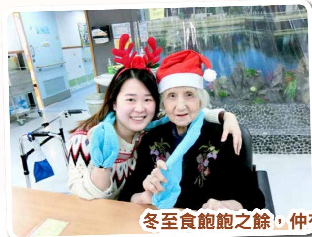
冬至食飽飽之餘，仲有暖笠笠嘅頸巾收添呀！