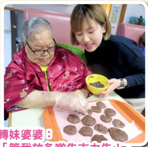
轉妹婆婆：「等我放多啲朱古力先！」