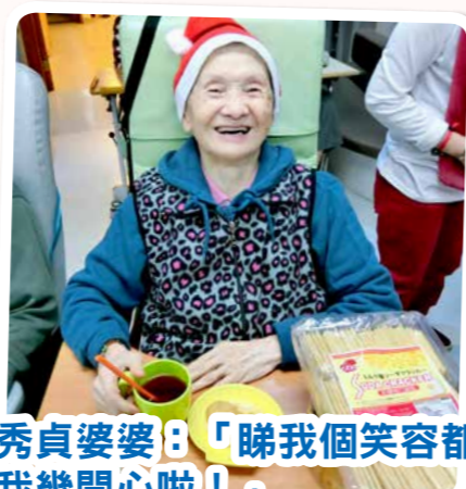
秀貞婆婆：「睇我個笑容都知我幾開心啦！」