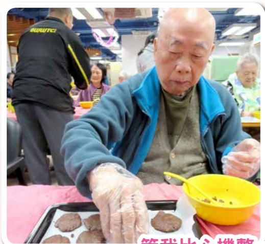
等我比心機整，送比我個老友先！