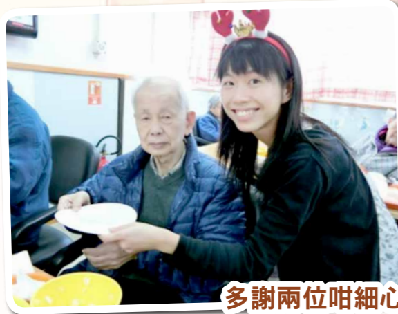
多謝兩位咁細心幫我哋搵蝦殼呀！