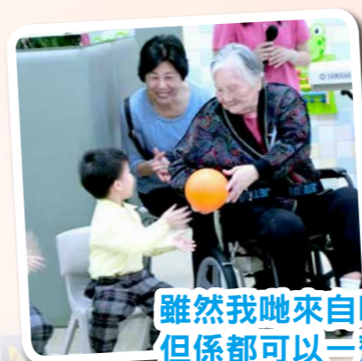
雖然我哋來自唔同年代，但係都可以一齊玩、一齊笑！

感謝老有所為基金的贊助，讓老友記在雞年的最後一個季度到訪幼稚園，欣賞幼兒的天才表演、互相分享，達到長幼共融。同時，老友記為幼兒們送上自製的手工藝品，對老友記的能力增添肯定，進一步體現關愛精神及把這份開心、正能量傳遞到社區。