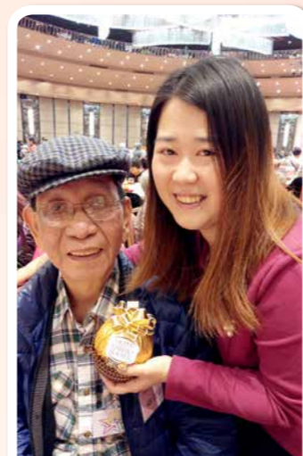
有靚靚姑娘同我影相，仲有咁大粒金莎，可以留返俾咗孫食啦！