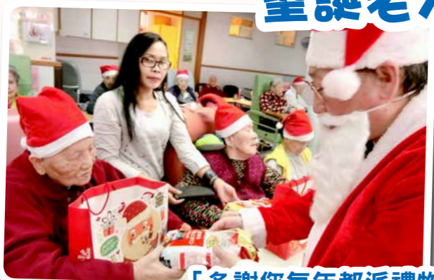
「多謝您每年都派禮物比我哋呀聖誕老人！」