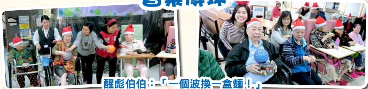
醒彪伯伯：「一個波換一盒麵！」