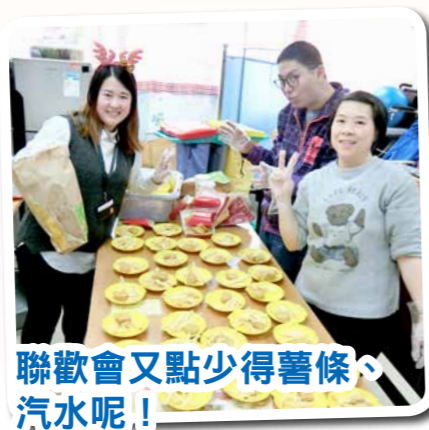
聯歡會又點少得薯條、汽水呢！