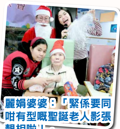
麗娟婆婆：「緊係要同咁有型嘅聖誕老人影張靚相啦！」