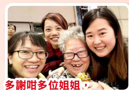
多謝咁多位姐姐，今日收穫好豐富呀！