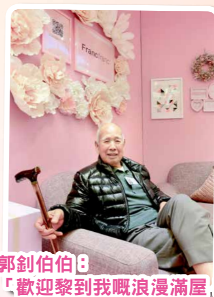
郭釗伯伯：「歡迎黎到我嘅浪漫滿屋！」