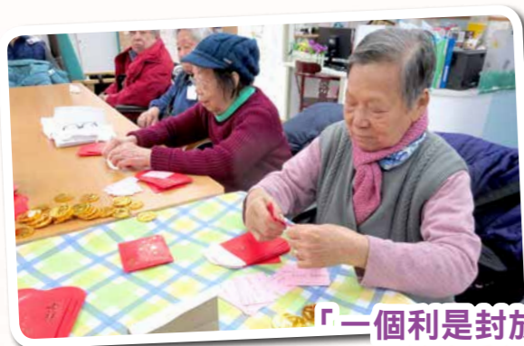
「一個利是封放張紙同粒金幣！」

一年易過又一年，雞年過去到狗年！為了好好迎接新春，老友記亦做足準備，包好利是準備派！